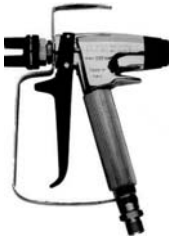
Краскораспылитель высокого давления

AT250 -250 бар. AT300 -300 бар L91X -500 бар.