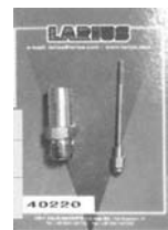
ремкомплект к краскопульту

23801 Calolziocorte (LECCO) ITALY. tel. +39 0341 62 1 1 52 fax +39 0341 621 243 www.larius.com larius@larius.com