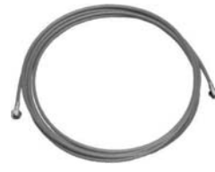
Шланг для ЛКМ 250 бар.

арт. 18023-A3000 арт. 18026-A8000 арт. 18510-STORM