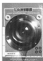
мембраны в сборе