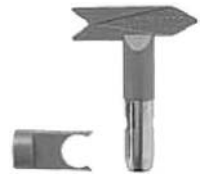
Fast Clean реверсное сопло