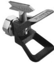
Соплодержатель реверсного сопла

арт. 300 -EUROPA арт. 315 -USA арт.318 - ASIA